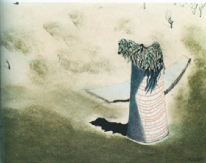
Silo • 2008 • 30 x 40 cm • potlood, pastel • 595,- euro