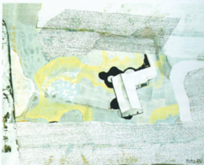
Weert • 2008 • 47 x 70 cm • tempera, potlood, pastel • 1150,- euro