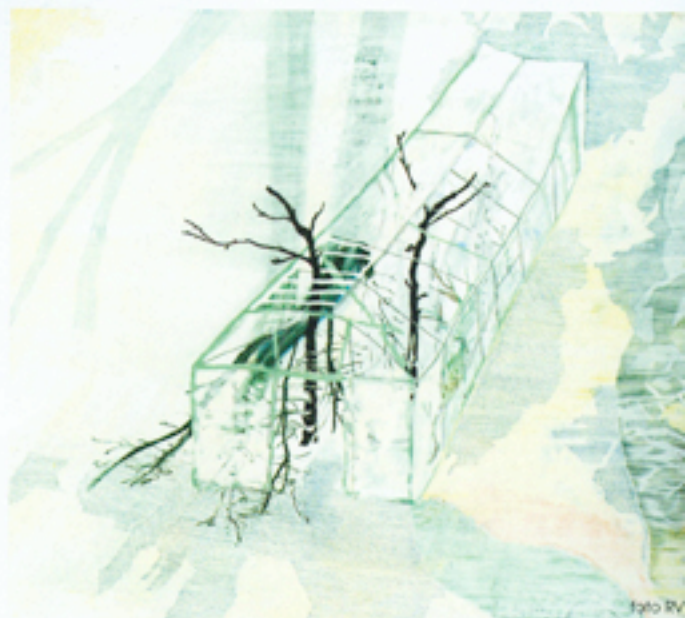
Kas 1 • 2007 • 36,5 x 47 cm • tempera, potlood, pastel • 650,- euro

Met dank ook aan de inspirerende tekst 'Project Nederland' van Willem van Toorn